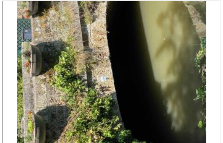
Repère de crue du 31 mai 2016 de l'Yvette à Chevreuse