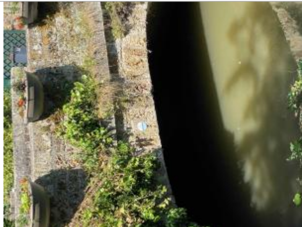
Repère de crue du 31 mai 2016 de l'Yvette à Chevreuse