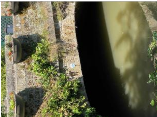
Repère de crue du 31 mai 2016 de l'Yvette à Chevreuse