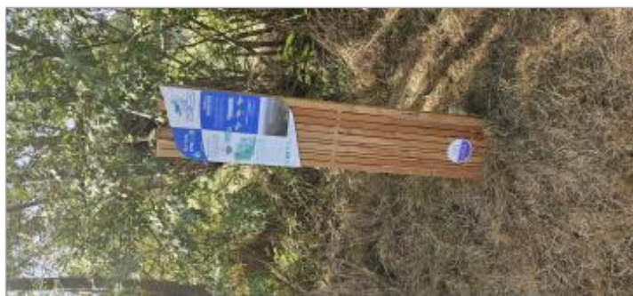
Longèves - Parking des chasseurs