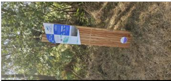
Longèves - Parking des chasseurs

GÉNÉRAL Code : WEB_R_202602130447 Date de mise à jour : 13/02/2026 Auteur : CDC Aunis Atlantique