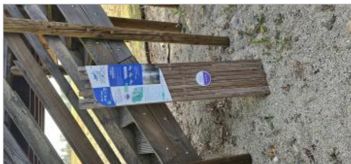
Angliers - Route de la Loge