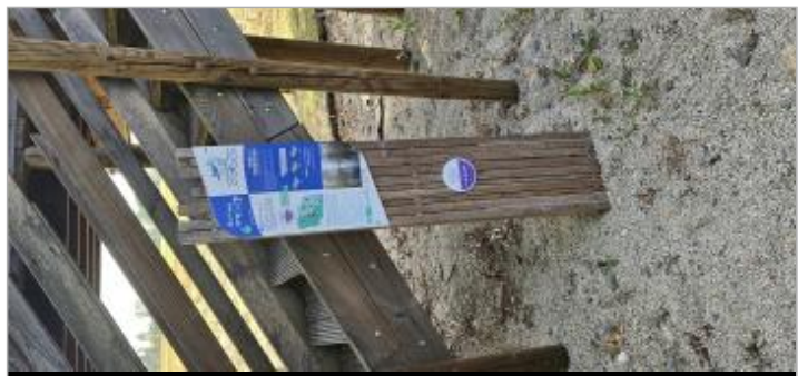
Angliers - Route de la Loge

GÉNÉRAL Code : WEB_R_202602130122 Date de mise à jour : 13/02/2026 Auteur : CDC Aunis Atlantique