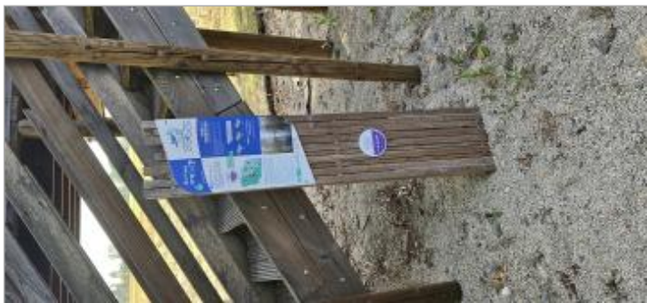
Angliers - Route de la Loge

GÉNÉRAL Code : WEB_R_202602130122 Date de mise à jour : 13/02/2026 Auteur : CDC Aunis Atlantique