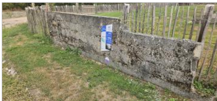
Angliers - Rue de la Gravette

Visibilité : Oui Repère calculé : Oui PHEC : Oui