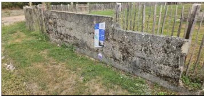
Angliers - Rue de la Gravette

GÉNÉRAL Code : WEB_R_202602134917 Date de mise à jour : 13/02/2026 Auteur : CDC Aunis Atlantique