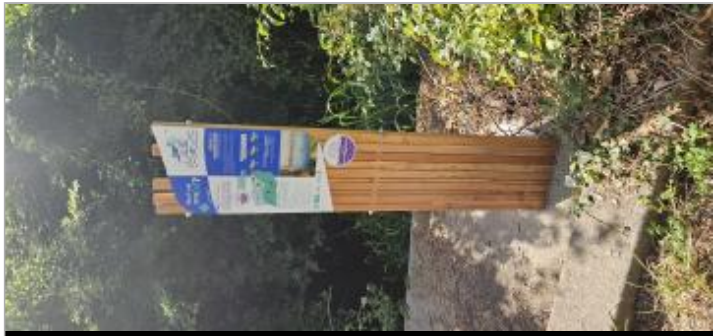
Cram-Chaban - Le Lavoir