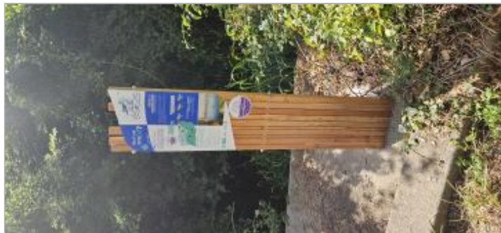
Cram-Chaban - Le Lavoir