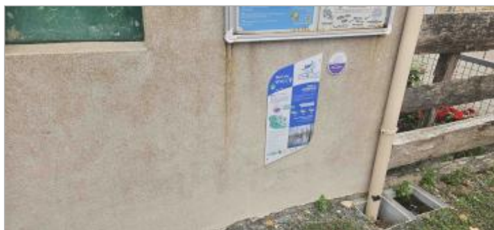
Nuaille d'Aunis - Plan d'eau

Code : WEB_R_202602134048 Date de mise à jour : 09/04/2026 Auteur : CDC Aunis Atlantique