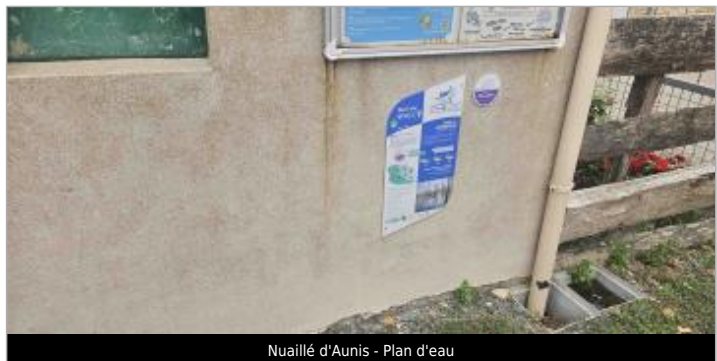
Nuaille d'Aunis - Plan d'eau

GÉNÉRAL Code : WEB_R_202602134048 Date de mise à jour : 09/04/2026 Auteur : CDC Aunis Atlantique