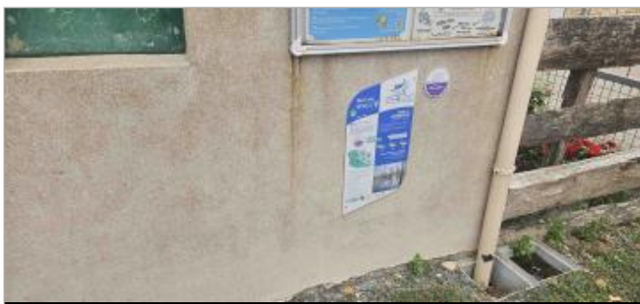
Nuaille d'Aunis - Plan d'eau