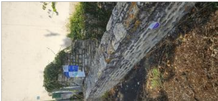
Bouhet - Le Jaud