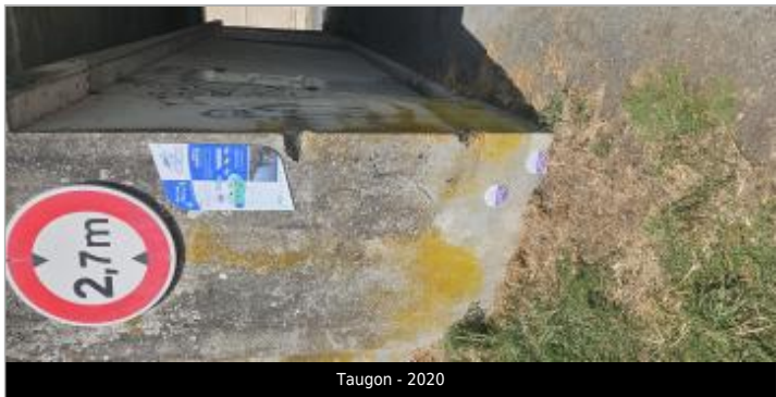
Taugon - 2020

GÉNÉRAL Code : WEB_R_202602130834 Date de mise à jour : 13/02/2026 Auteur : CDC Aunis Atlantique