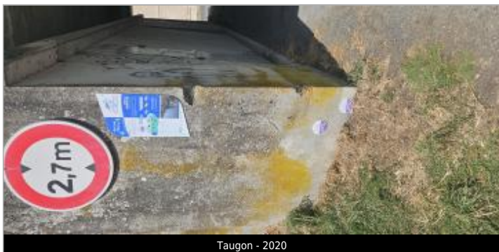
Taugon - 2020

Texte : La Sèvre Niortaise - 2020 Visibilité : Oui État du repère : Bon PHEC : Oui Repère calculé : Oui