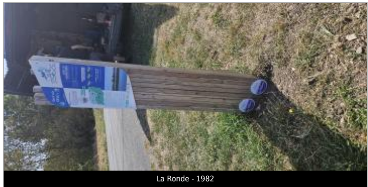
La Ronde - 1982

GÉNÉRAL Code : WEB_R_202602130125 Date de mise à jour : 13/02/2026 Auteur : CDC Aunis Atlantique