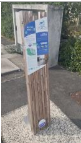
Repère - Anais Les grandes rivières