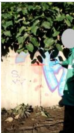
Vue rapprochée de la laisse de crue