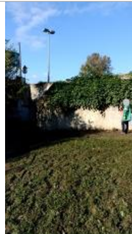
Vue générale du site, auteur DDT 42

Coordonnées WGS84 : X: 4.56471672 / Y: 45.50226730