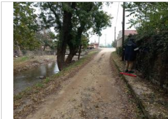
Vue générale du site, prise de vue du 31/10/2024

Coordonnées WGS84 : X: 4.73565833 / Y: 45.41380160