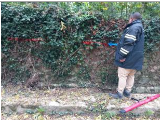
Vue rapprochée de la laisse de crue, prise de vue du 31/10/2024

Altitude calculée de l'eau (en m) : 147.03