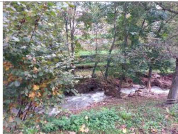
Vue générale du site, prise de vue du 22/10/2024

Coordonnées WGS84 : X: 4.68503666 / Y: 45.41565830