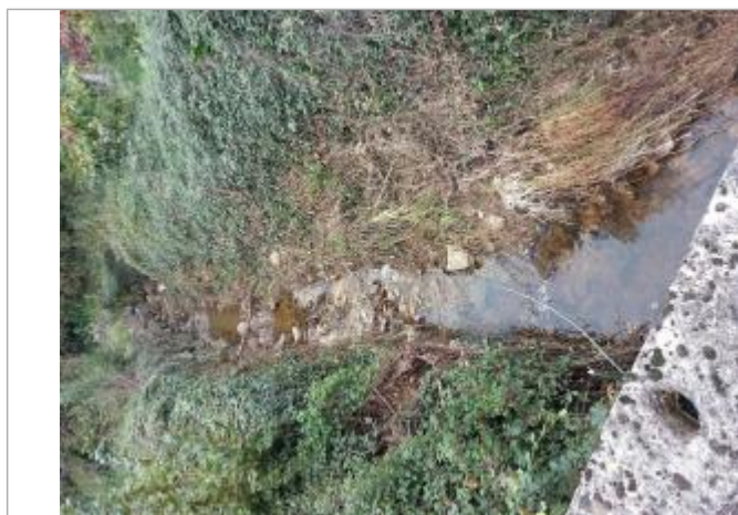
Vue rapprochée de la laisse de crue, prise de vue du 31/10/2024