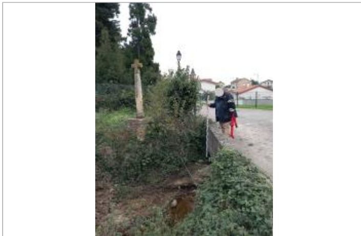
Vue générale du site, auteur DDT 42, prise de vue du 31/10/2024

Coordonnées WGS84 : X: 4.74227399 / Y: 45.43230830