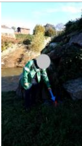
Vue rapprochée de la laisse de crue

SOURCE DE REPÉRAGE : LAISSES DE CRUES RÉALISÉES PAR LA DDT 42 SUITE À L'ÉVÉNEMENT DU 17/10/2024 SUR LE GIER. - 22/10/2024