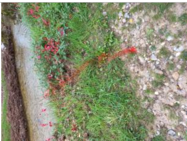
Vue rapprochée de la laisse de crue, auteur : DDT 42, prise de vue du 31/10/2024

Altitude calculée de l'eau (en m) : 146.1