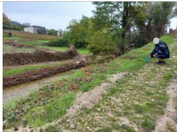
Vue générale du site, prise de vue du 31/10/2024