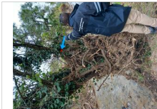
Vue rapprochée de la laisse de crue, prise de vue du 31/10/2024

SOURCE DE REPÉRAGE : LAISSES DE CRUES RÉALISÉES PAR LA DDT 42 SUITE À L'ÉVÈNEMENT DU 17/10/2024 SUR LE GIER. - 22/10/2024