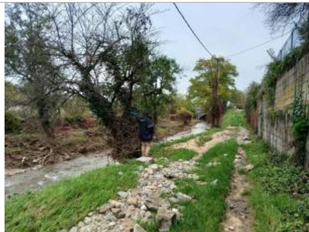
Vue générale du site, prise de vue du 31/10/2024