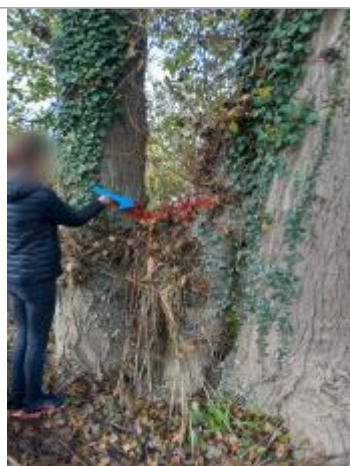
Vue du repère en 2024

Altitude calculée de l'eau (en m) : 257.96 m