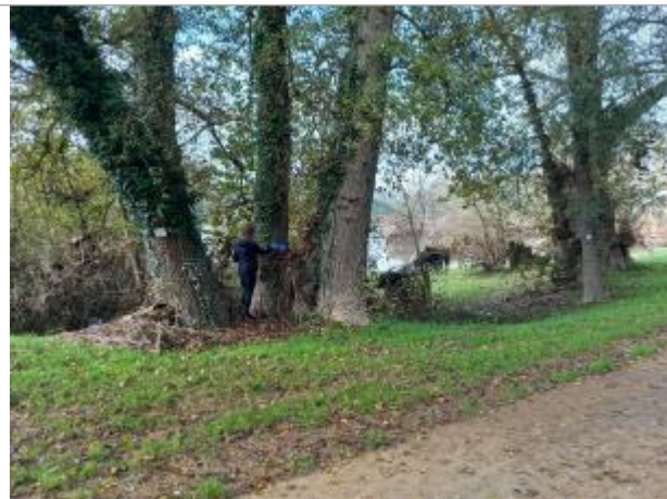
Vue du site en 2024