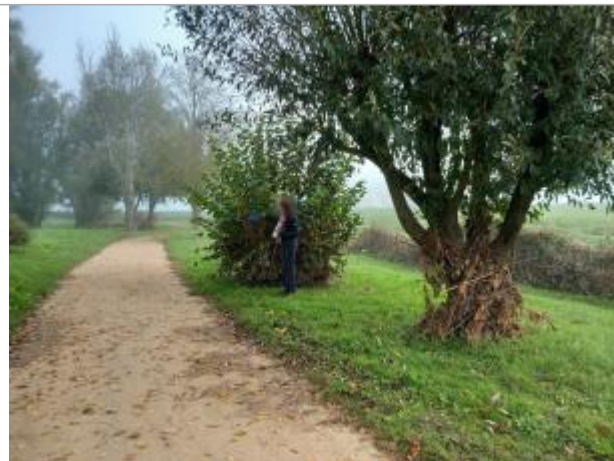
Vue du site en 2024