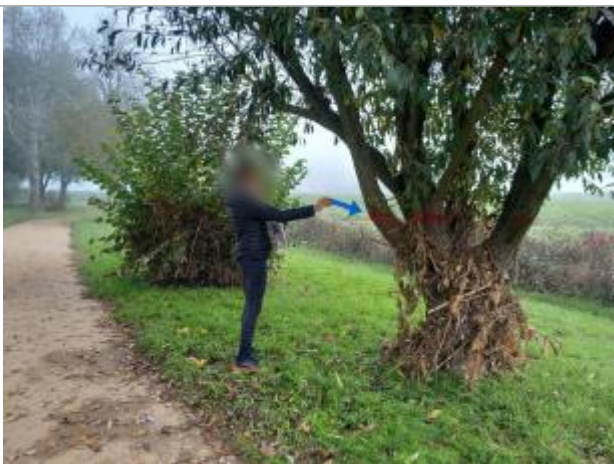
Vue du repère en 2024

Altitude calculée de l'eau (en m) : 258.04 m