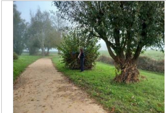
Vue du site en 2024

Coordonnées WGS84 : X: 4.09882333 / Y: 46.14830500