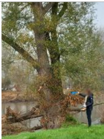
Vue du repère en 2024

Altitude calculée de l'eau (en m) : 258.36 m