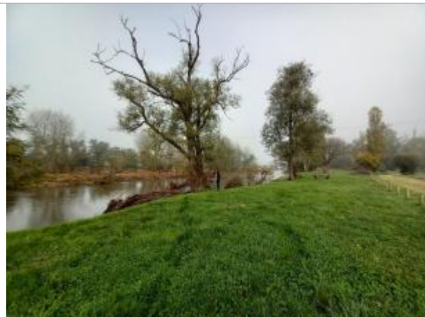
Vue du site en 2024