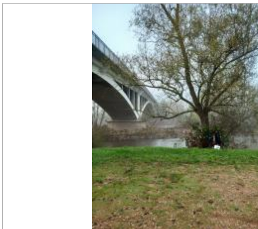
Vue du site en 2024

Coordonnées WGS84 : X: 4.09877000 / Y: 46.14721490