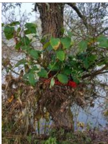
Vue rapprochée du repère en 2024