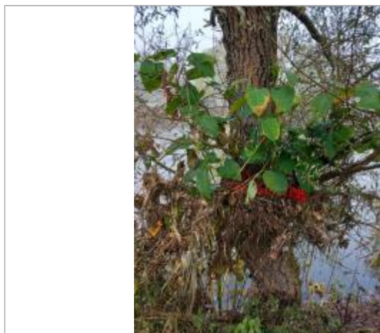
Vue rapprochée du repère en 2024

SOURCE DE REPÉRAGE : DDT42, LA LOIRE, CRUE D'OCTOBRE 2024 - 30/10/2024