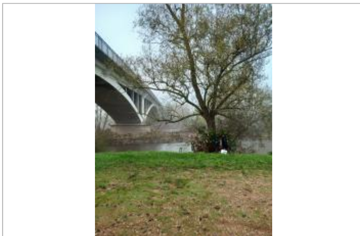
Vue du site en 2024