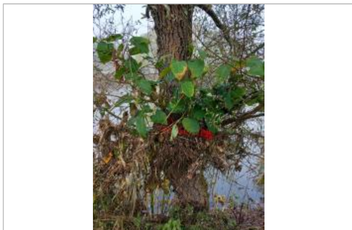
Vue rapprochée du repère en 2024

SOURCE DE REPÉRAGE : DDT42, LA LOIRE, CRUE D'OCTOBRE 2024 - 30/10/2024