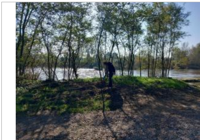
Vue du site en 2024