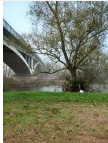
Vue du site en 2024