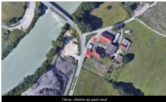
l'Arve, chemin du pont neuf