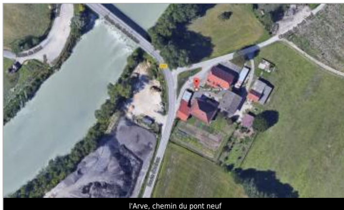
l'Arve, chemin du pont neuf

Coordonnées WGS84 : X: 6.27144760 / Y: 46.14964600