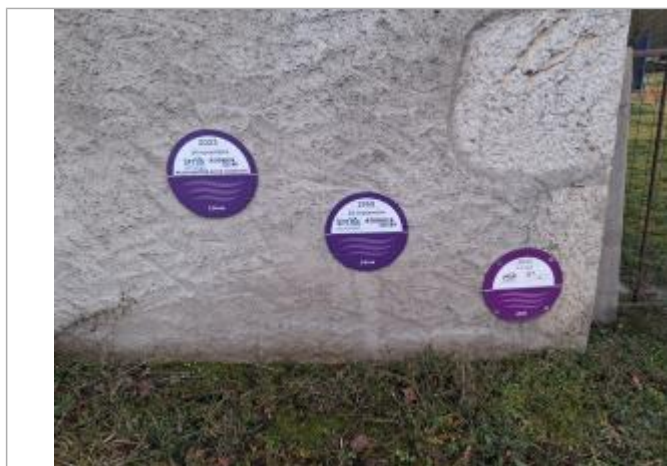
repère de la crue de 2023 à Reignier (en haut)

Texte : crue de l'Arve du 14 novembre 2023