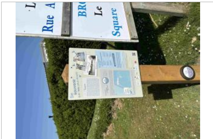
Repère de crue et panneau pédagogique Submersion de février 1990