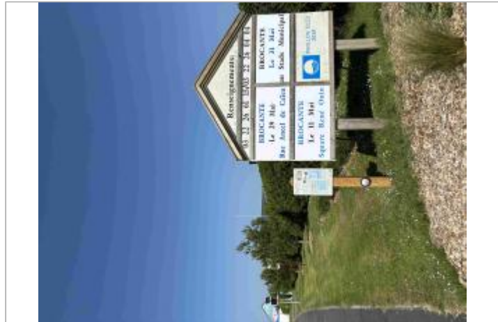
Panneau d'affichage - entrée du camping de l'ancienne église