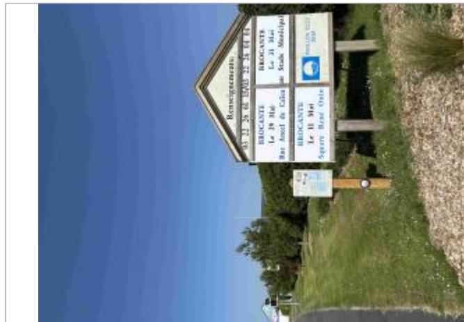
Panneau d'affichage - entrée du camping de l'ancienne église