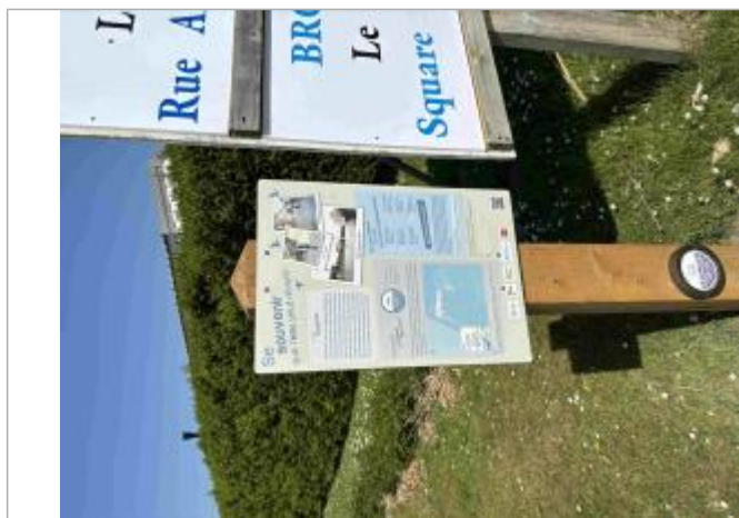
Repère de crue et panneau pédagogique Submersion de février 1990