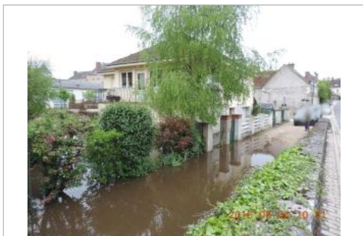
Photo prise pendant la crue

Maximum de l'inondation : Oui Visibilité : Oui