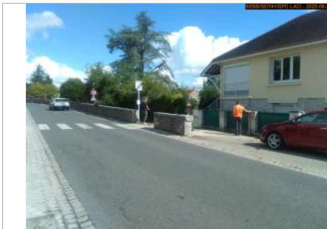
Vue du site en 2025, avec le repère de la crue de mai 2015