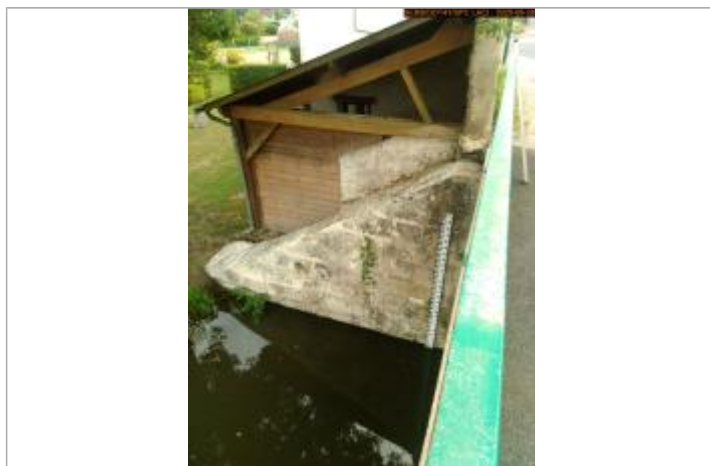
Vue de l'échelle en 2025