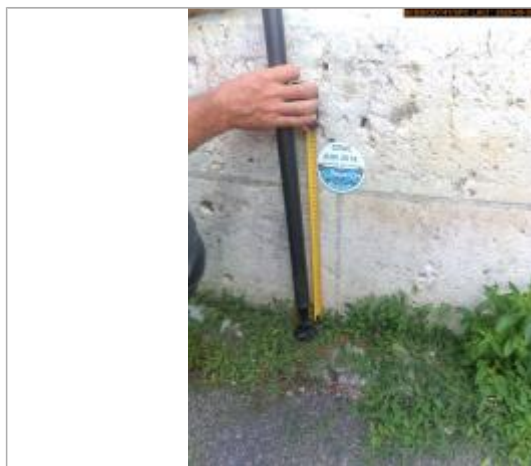
Vue du repère en 2025

Altitude calculée de l'eau (en m) : 77.898 m