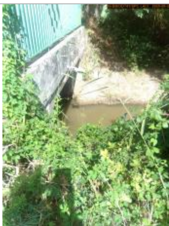
Vue de l'échelle en 2025