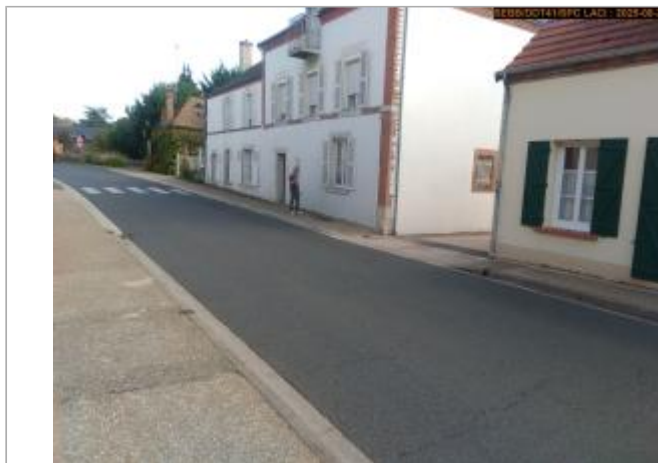
Vue du site en 2025

Coordonnées WGS84 : X: 1.67342500 / Y: 47.65464000