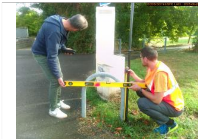
Vue du repère en 2025

Altitude calculée de l'eau (en m) : 70.549 m