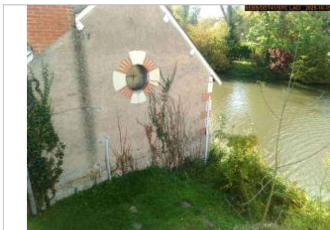
Vue de l'échelle en 2025