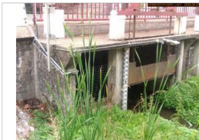
Vue de l'échelle en 2025