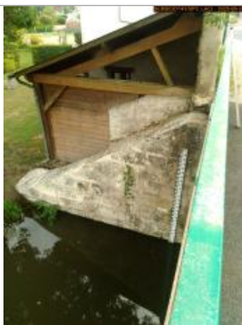
Vue de l'échelle en 2025