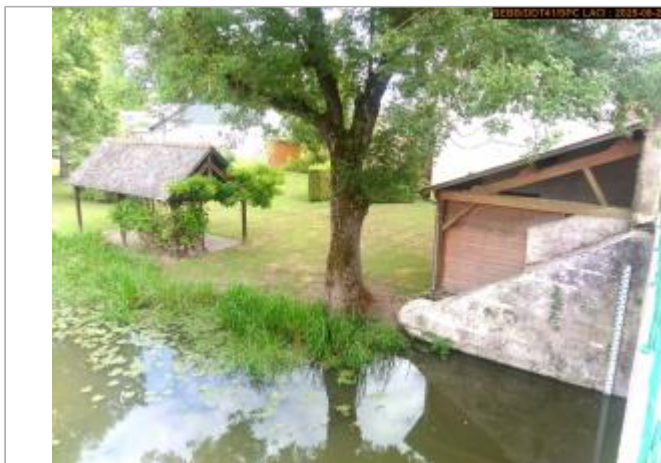
Vue du site en 2025

Coordonnées WGS84 : X: 1.45806600 / Y: 47.50614600