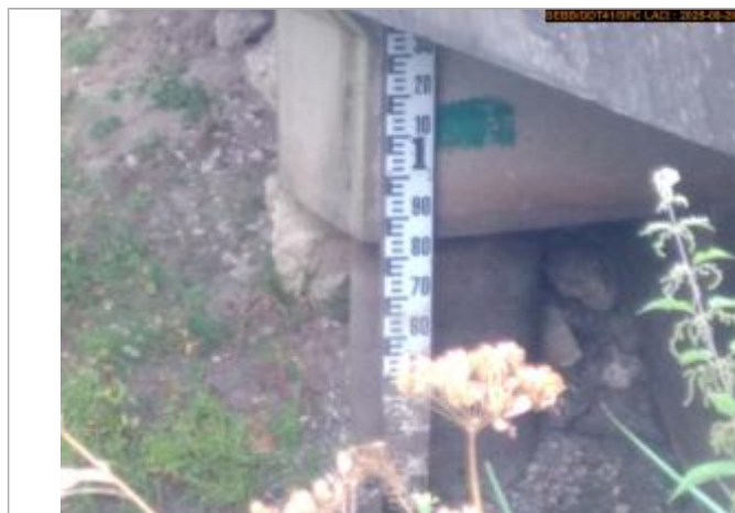
Vue de l'échelle en 2025

Altitude calculée de l'eau (en m) : 84.22