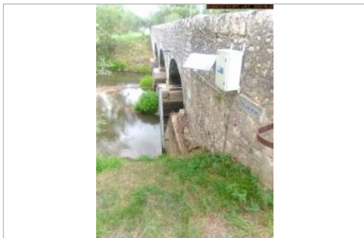
Vue de l'échelle en 2025