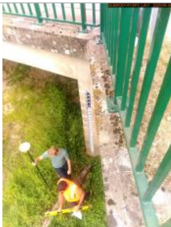
Vue de l'échelle en 2025