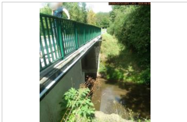
Vue de l'échelle en 2025