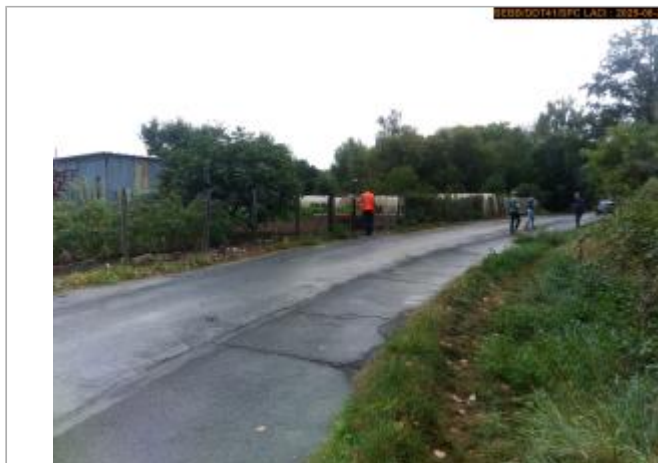
Vue du site en 2025