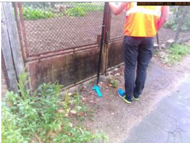
Vue du repère en 2025

Altitude calculée de l'eau (en m) : 68.514