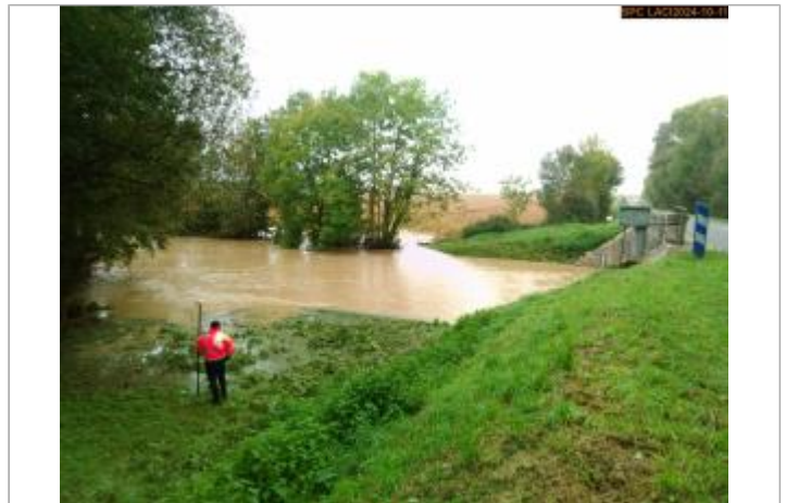
Vue sur le site

Coordonnées WGS84 : X: 1.38214167 / Y: 48.21670420