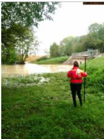
Vue sur la laisse d'inondation

Altitude calculée de l'eau (en m) : 126.72 m