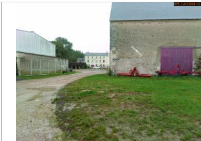
Vue sur le bâtiment

Coordonnées WGS84 : X: 1.37689554 / Y: 48.22242910