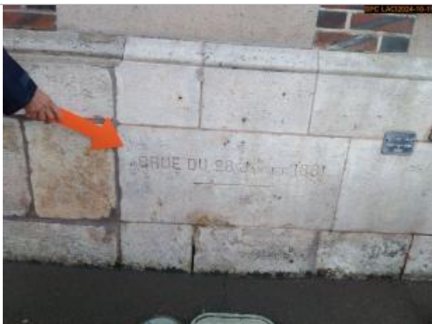
Vue sur la marque gravée

Altitude calculée de l'eau (en m) : 122.87 m