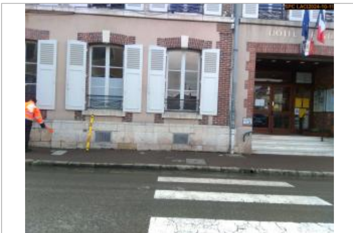
Vue sur la façade de la mairie