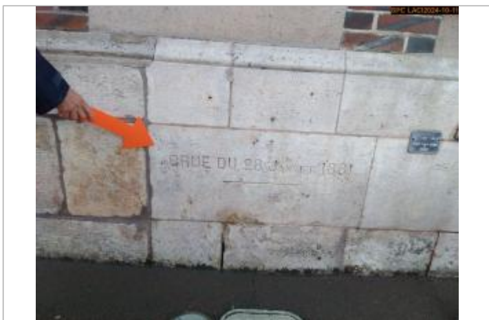
Vue sur la marque gravée