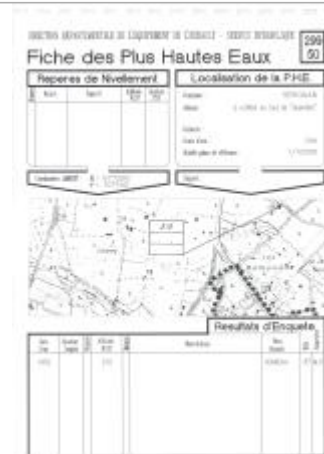
Fiche descriptive d'origine