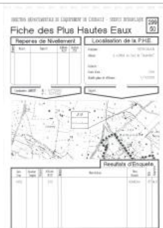
Fiche descriptive d'origine