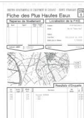
Fiche descriptive d'origine, source DDTM34