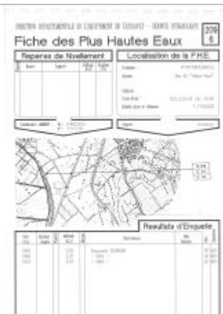
Fiche descriptive d'origine, source DDTM34

Altitude calculée de l'eau (en m) : 2.31 m